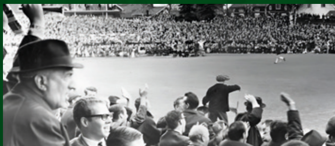
Publikrekord på Domnarvsvallen – 14 206 personer.