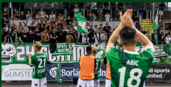
Starkt stöd från våra supportrar på våra läktaren.