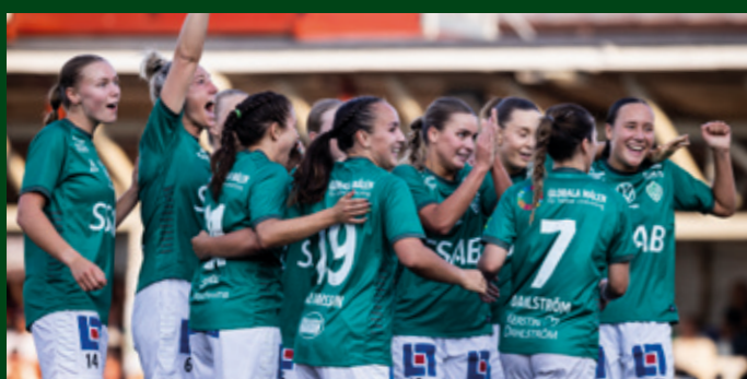
Damerna vann division 2 och kvalificerade till i division 1 2023.